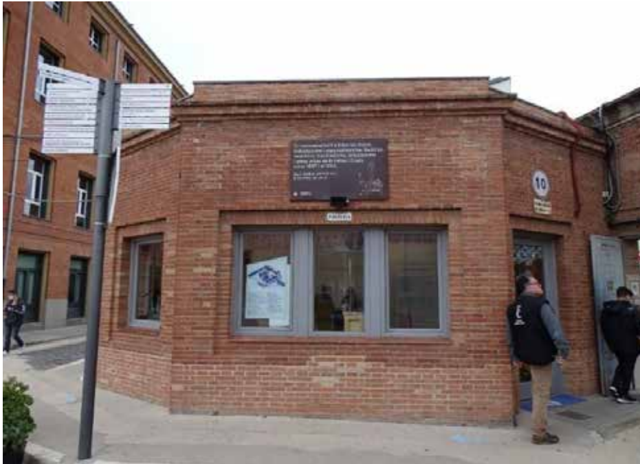
Figure 1. Entrance of the Fabra i Coats factory complex in Sant Andreu de Palomar (Barcelona). November 2021.

To work on these objectives, the authors have decided to analyse some urban spaces with distinctly post-industrial characters whose histories denoted a series of visible and invisible transformations. In Sant Andreu de Palomar, a district of Barcelona, the case study is centred on the Fabra i Coats, once a factory and today a cultural centre that has been one of the main motors behind the creation and development of the area. The factory underwent a process of decline from the 1970s to the 2000s 2 , ending with its closure in 2005 ( Figure1 ).