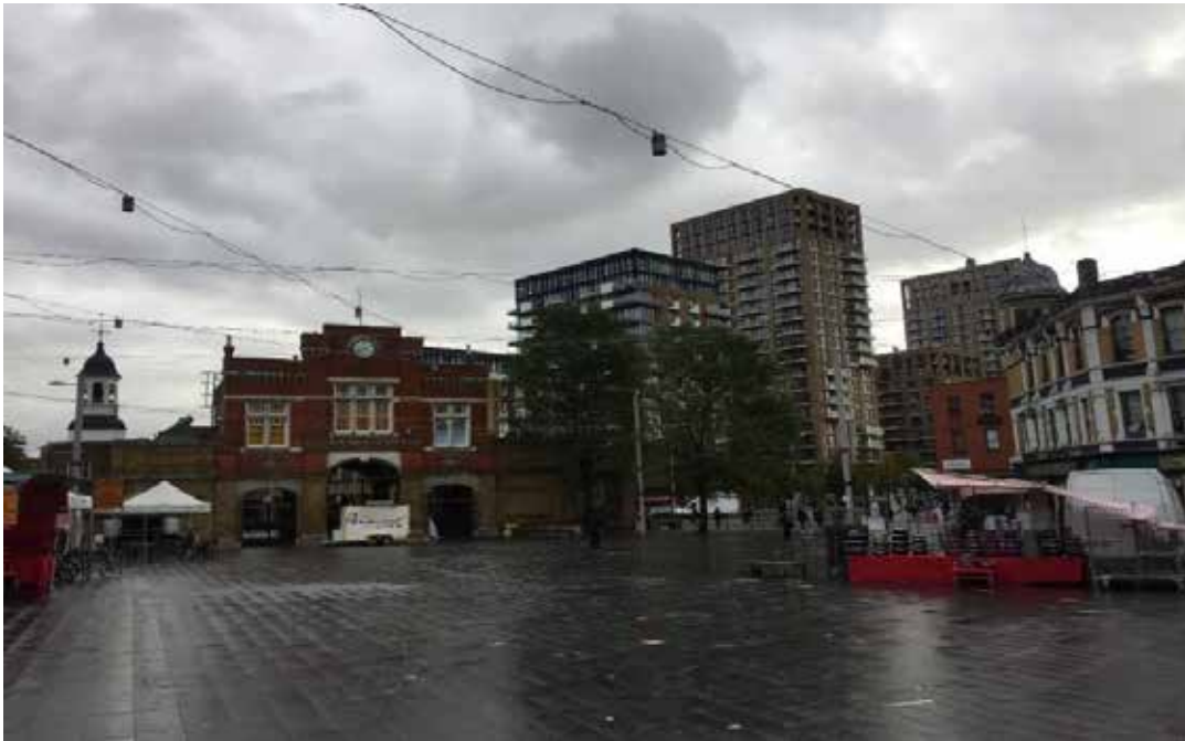
Figure 2. Woolwich (London). Beresford Square. October 2021.

In London, the focal study is Woolwich Town Centre. It has recently been characterised as a conservation area with particular emphasis on the Beresford square and its gate, which used to form the entrance to the Royal Arsenal (a formerly industrial site accommodating factories for weaponry) ( Figure 2 ).